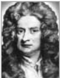
Sir Isaac Newton 1643 - 1727

Der englische Physiker, Mathematiker und Astronom Sir Isaac Newton entdeckte im Jahr 1682 das Gravitationsgesetz, als ihm eher zufällig in seinem Garten ein Apfel auf den Kopf fiel. Damit gelang es zum ersten Mal, ein umfassendes Weltgesetz aufzustellen.